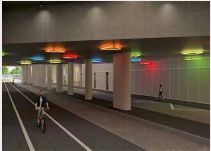
Le futur tunnel du boulevard de l'Oise