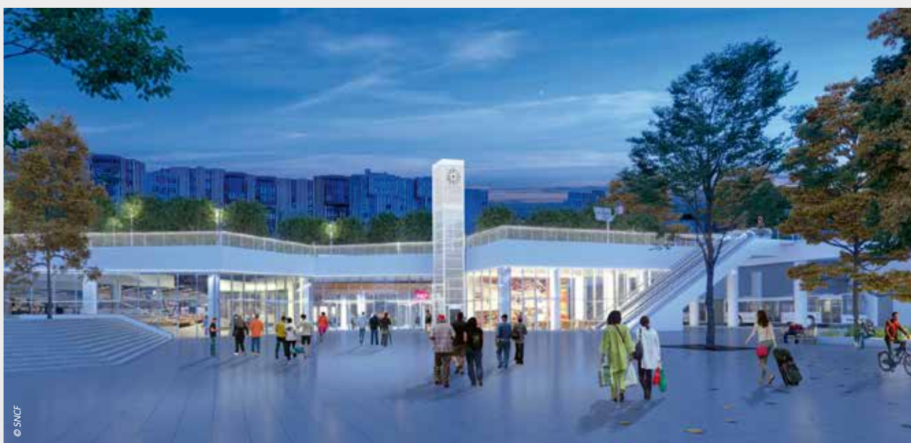
Le futur bâtiment voyageurs