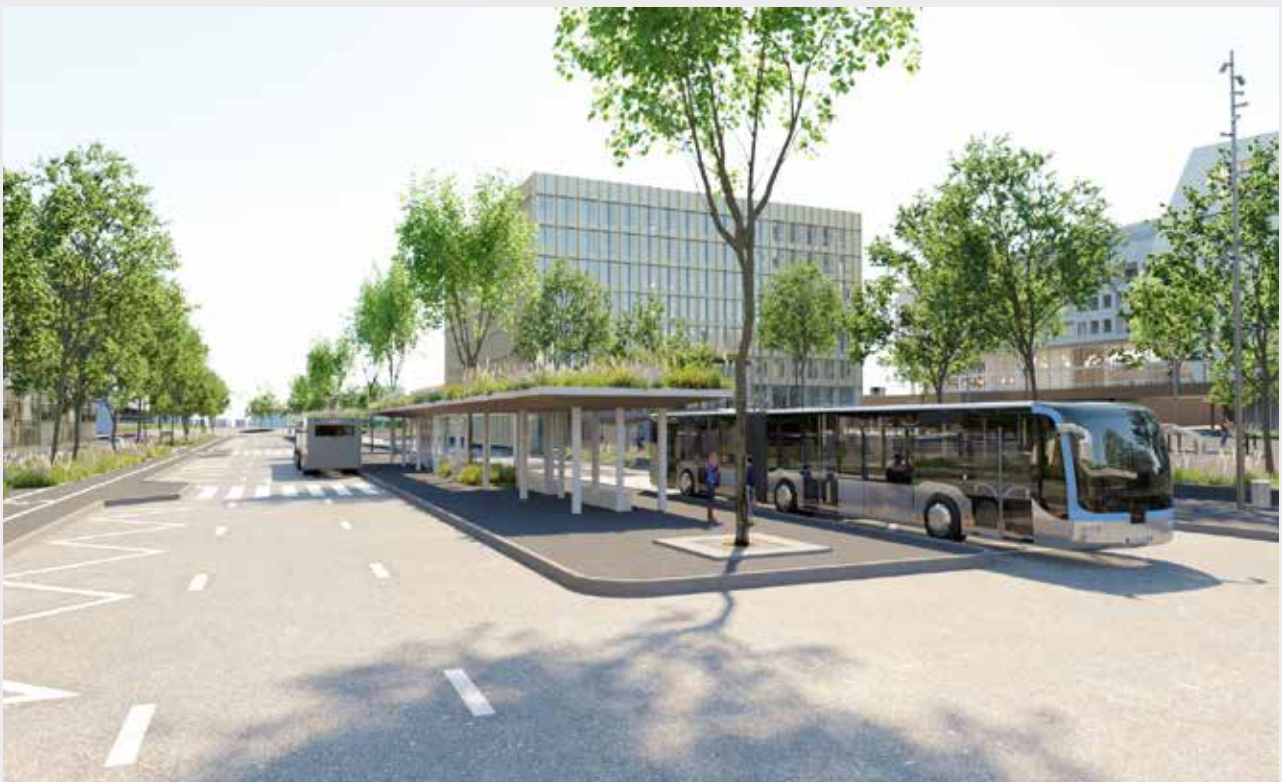
Les quais jardins de la future gare routière