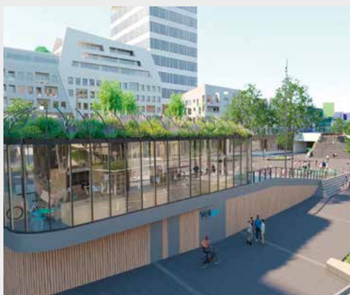
La végétalisation du futur parvis